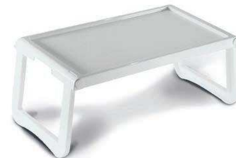
Taca śniadaniowa, do łóżka (wys. 24 cm, szer. 56x35 cm)