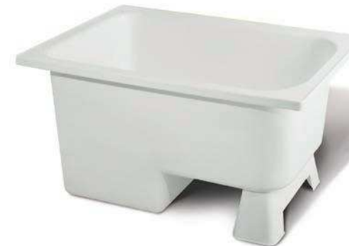
Wanna MARINELLA, z siedziskiem (52 cm wys., szer. 105x65 cm)