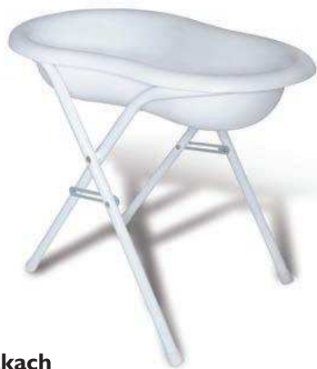
Bidet na nóżkach