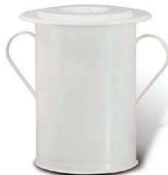
Nocnik duży, z pokrywą